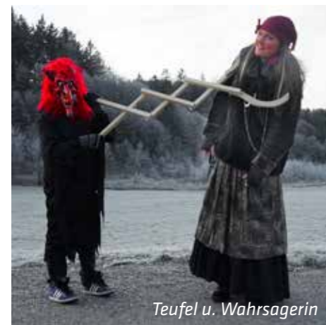
Teufel u. Wahrsagerin