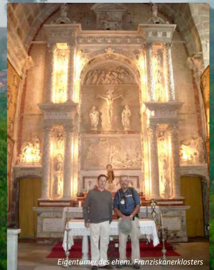
Eigentümer des ehem. Franziskanerklosters