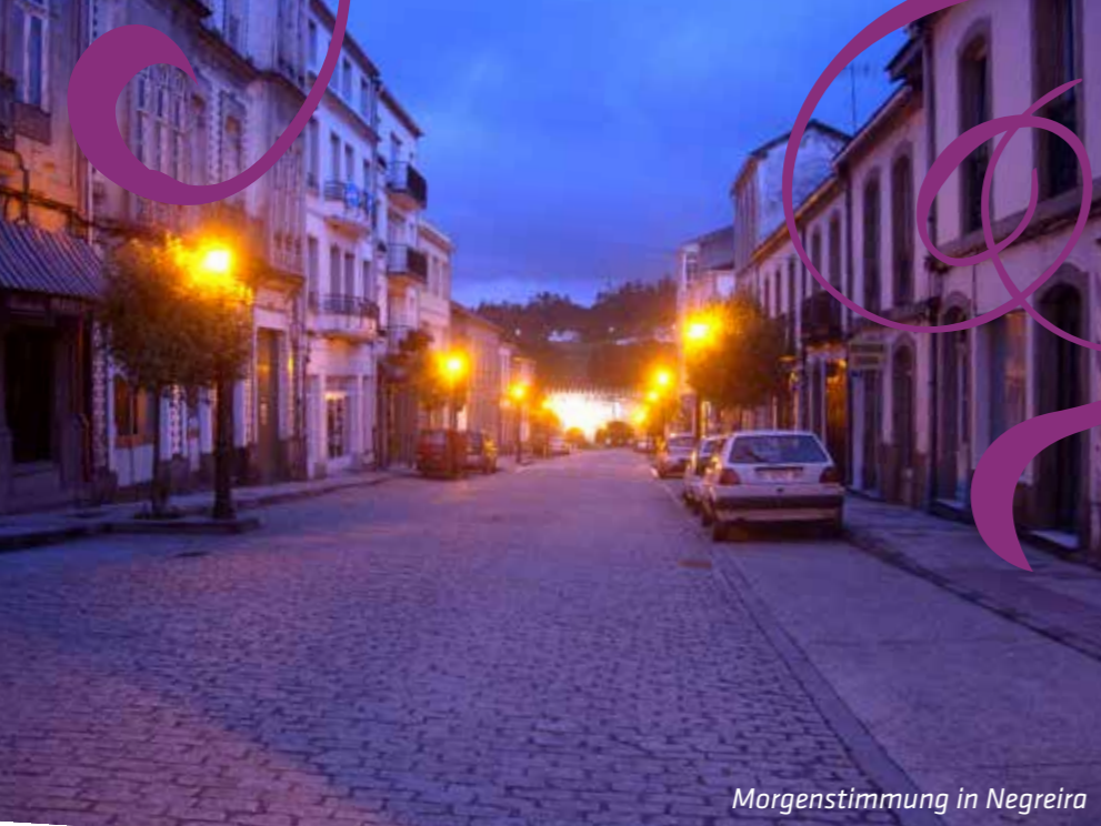
Morgenstimmung in Negreira

mich ebenfalls sehr beeindruckte. Der zweistöckige Altar war wunderschön und aus italienischem Marmor gefertigt. Gut eine halbe Stunde dauerte die Führung, bei der ich sehr viel Geschichtliches erfuhr, selbst Könige hätten in diesem Kloster genächtigt.