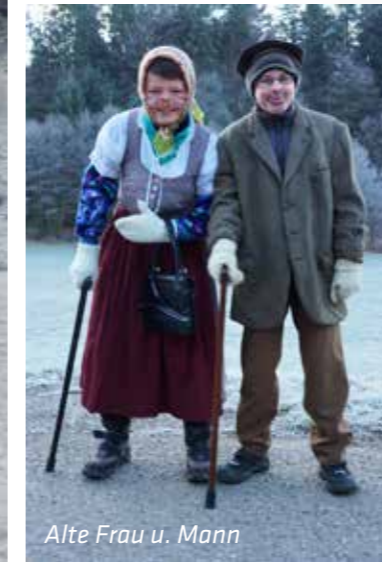
Alte Frau u. Mann